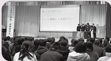
▲ 地域の協力事業者も招いた会場で発表する様子