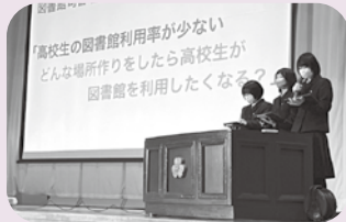
▲ 校内選考を通過した代表生徒

2年生は「自分の好きを活かして、糸魚川の困ったさんを笑顔にしよう!」をテーマに、29班に分かれて、1年間を通して地域探究活動を行ってきました。その内、図書館の利用促進や農園への誘客などの課題解決に挑戦した代表7班が活動成果を発表しました。