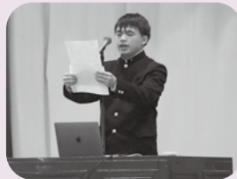
▲ NIE※活動の発表をした代表生徒

1年生は、総合的な探究の時間にNIE※に取り組んでいます。昨年夏に県内各所で取材を行い、新聞記事を作成しました。