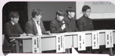
海洋高校での学びや自分の将来の夢をテーマに、地元産業界の方々とのパネルディスカッションも行いました。

文部科学省の委託を受け、令和3年度から海洋高校で取り組んできた、未来を担う海洋・水産プロフェッショナル人材の育成を掲げる「マイスター・ハイスクール事業」。市内中学生や関係者を招いて、各コースで研究に取り組んできた生徒たちが、産学官連携による実践的な学びの3年間の成果について発表を行いました。